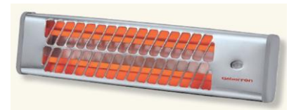
IC - 1200