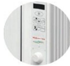
Εύχρηστο πληκτρολόγιο με προγραμματιστή