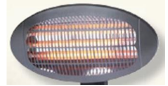
IDP - 2000