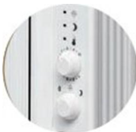
Ενσωματωμένο , εύχρηστο πληκτρολόγιο