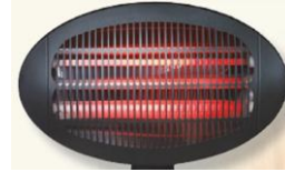
IDM - 2000